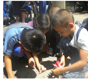
Die Kinder entdecken das Spiel und spüren Gemeinschaft.