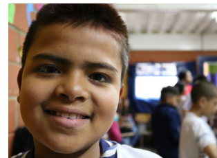
Dank der künstlerischen Handlungen, ziehe ich mich von Gewalt zurück.