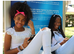
Wenn ich in COMBOS bin, fühle ich mich sicher.