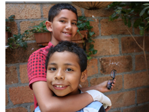
Lachen, spielen, rumalbern, Kind sein.