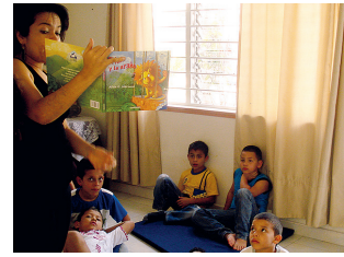
Geschichten, Theater, Tanz und Spiel helfen, Fuss zu fassen und dem Leben mit neuer Freude zu begegnen.

COMBOS arbeitet seit 2006 in einem Randviertel Medellins, wo sich hauptsächlich Landflüchtlinge ansiedelten. Den Kindern, Jugendlichen und Frauen wird durch Kreativität und künstlerische Mittel Unterstützung in der Verarbeitung der Vergangenheit und Gegenwart geboten. Nachhilfeunterricht erleichtert den Wiedereinstieg in die Schule.