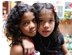
Die Kinder können ihr Leben mit Freude gestalten