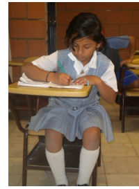
Kinder, die arbeiten müssen, können bei COMBOS die Schule besuchen.

Lehrplan, Unterrichtsmaterialien und Schulzeiten wurden den Bedürfnissen und der Realität der Kinder angepasst. Ein weiteres Ziel von COMBOS ist, die Arbeitsbedingungen der Kinder zu verbessern und die Familien so zu unterstützen, dass die Kinder weniger oder gar nicht mehr arbeiten müssen.